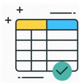
TABELA DE VALORES EM VIGOR EM 2022

Lembrando que aposentadoria por invalidez e aposentadoria compulsória o processo é aberto pelo RH do ente e não pelo servidor.